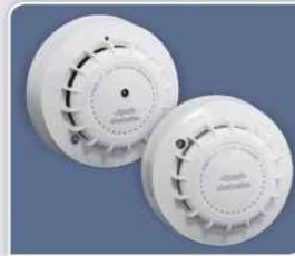
BS-655/12V & BS-660/12V

Φαροσειρήνα για πίνακα Πυρ/σης BS-642 (230V).